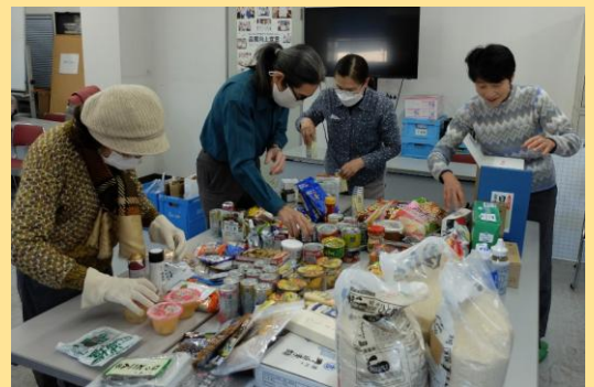
活動支援しているフードバンクみたか

また、ボランティアグループやNPO法人の活動をサポートし、ボランティア活動の普及に努めています。