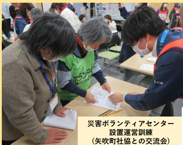
災害ボランティアセンター 設置運営訓練 (矢吹町社協との交流会)

日頃から住民と災害に備えた取り組みを行い、災害時には災害ボランティアセンターを立ち上げ、運営します。