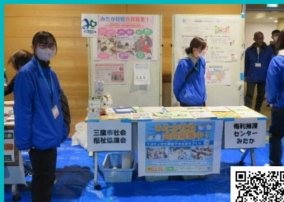
福祉バザーで会員募集

みたかの地域ニーズに合った事業を実施する為に会員加入・寄付の呼びかけを行っています。