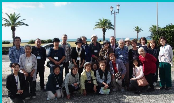
介護者同士の交流を目的に一泊旅行を開催

介護者談話室、介護者ひろば、男性介護者交流会、介護なんでも相談室など介護中の方が悩みや不安を打ち明けたり、介護に関する情報を交換できる場を作っています。