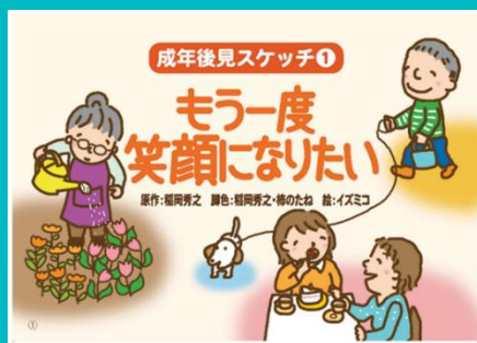
成年後見紙芝居の上演も行っています