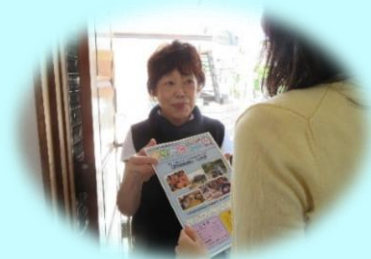
今年もお伺いさせていただきます

事業を継続するためにも、ほのぼのネット員や町会・自治会、老人クラブの方々などのご協力を得て会員の皆さまに会費納入のお願いをするとともに、新規会員を募集しています。