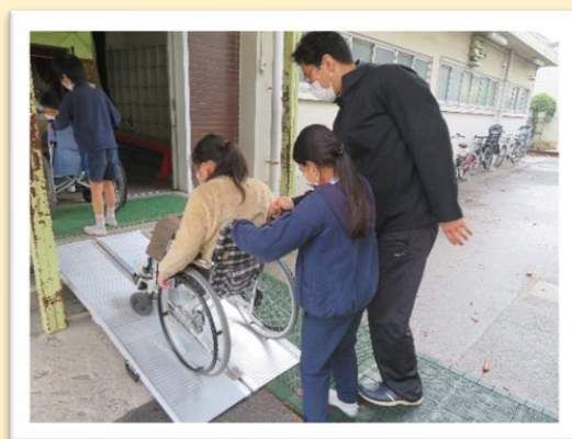
ボランティア出前講座

ボランティアをしたい、手伝って欲しいなどの相談を受け、コーディネートをしています。また、ボランティアグループやNPO法人の活動をサポートし、ボランティア活動の普及に努めています。