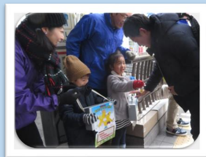
歳末たすけあい運動

みたかの地域ニーズに合った事業を展開する為に会員加入・寄付の呼びかけを行っています。