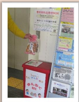
フードバンクみたか まんぶくBOX