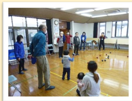
ほのぼのネット深大寺班 「ポッチャで遊ぼう」

ほのぼのネット活動は、地域の皆さまが住み慣れた地域でより安心して快適に暮らせるように、同じ地域に住む住民が「ほのぼのネット員」になって“支えあいのまちづくり”を進めるボランティア活動です。