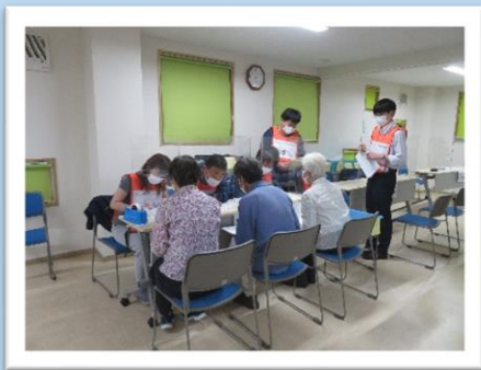
コロナ禍での災害ボランティアセンター設置運営訓練

みたか社協の活動を市民の皆さまに伝え、福祉・ボランティア活動の参加と協力を呼びかけています。