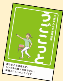
地域情報誌の発行、うごこっと体操