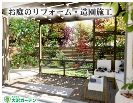
お庭のリフォーム・造園施工 大沢ガーデン