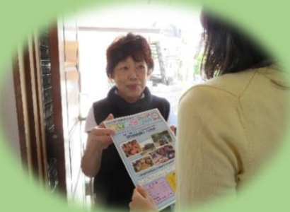
今年もお伺いさせていただきます

事業を継続するためにも、ほのぼのネット員や町会・自治会、老人クラブの方々等のご協力を得て会員の皆さまに会費納入のお願いをするとともに、新規会員を募集しています。