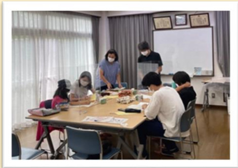
新しい「場」づくり ～連雀地区：無料学習会の開催～

地域共生社会の実現を目指し、福祉課題を抱える方や制度の狭間で苦しんでいる方などに継続的に寄り添い、その課題を解決するため地域にある様々な機関や団体と連携しながら住民相互の支え合い（共助）に取り組めるよう、大沢地区と連雀地区をモデル地区として地域福祉コーディネーターを配置しています。