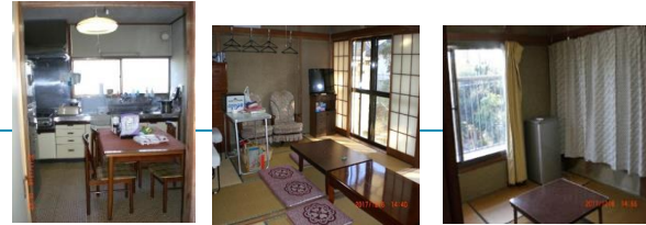
1階に和室10畳とキッチン、2階は4.5畳が2部屋と6畳の計3部屋あります。