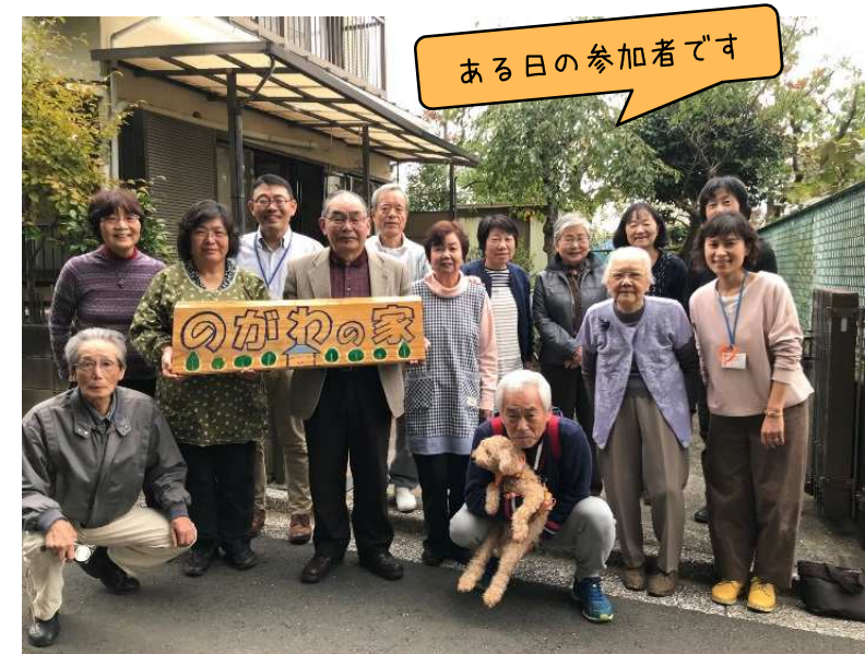
ある日の参加者です