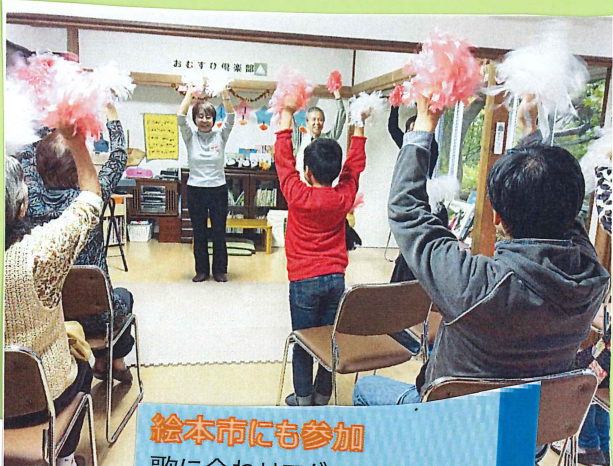
絵本市にも参加 歌に合わせてダンス♪