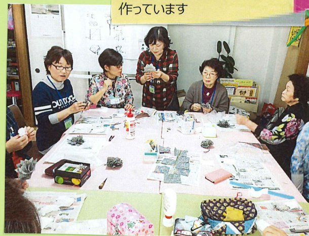
手づくりサロン 思い思いに作りたいものを 作っています