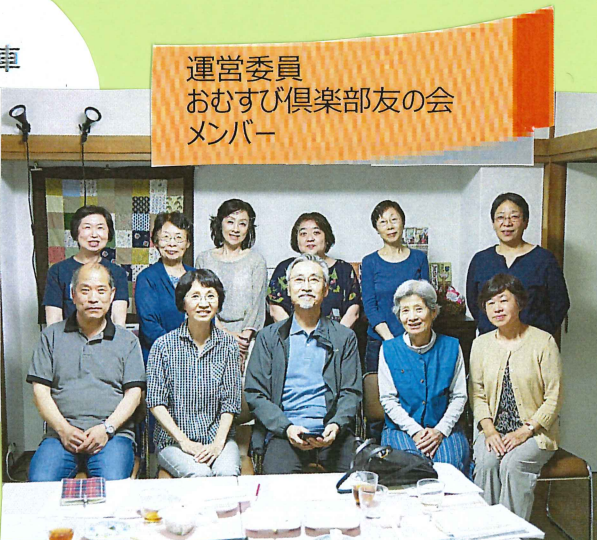
運営委員 おむすび倶楽部友の会 メンバー