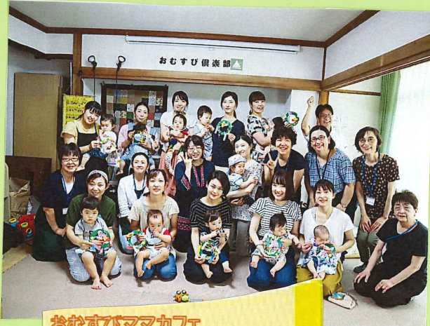
おむすびママカフェ 赤ちゃんママでも大歓迎

プログラム スタッフや参加者が共に それぞれの特技や好きなことを生かし 楽しめるよう、目指しています。