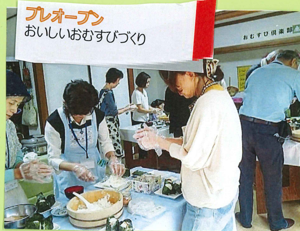
プレオープン おいしいおむすびづくり

人と人とを結びつけることが できるように 「おむすびハウス」 という名称にしました。