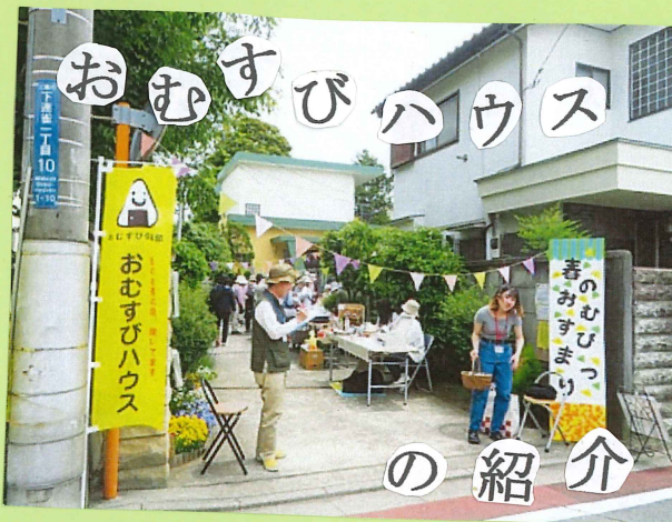
おむすびハウスの紹介