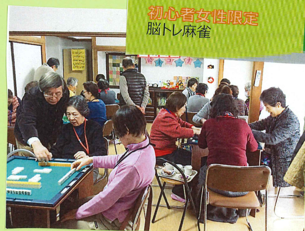
初心者女性限定 脳トレ麻雀