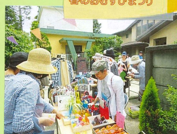
春のおむすびまつり