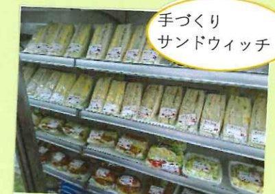
手づくり サンドイッチ