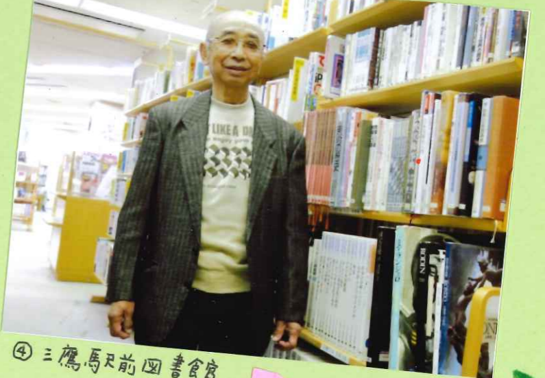
④ 三鷹馬車前図書館