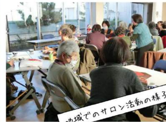
地域でのサロン活動の様子

この機関紙は、三鷹市内の方々には宛名シール貼り ボランティア、配達ボランティアさん(募集中!)のご協力 によりお届けしています。いつもありがとうございます。