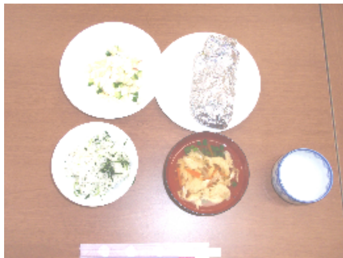
写真2：出来上がった料理（若菜ごはん、かき卵のすまし汁、白身魚のホイル包み蒸し、はんぺんのりんご和え、苺ヨーグルト）です！！