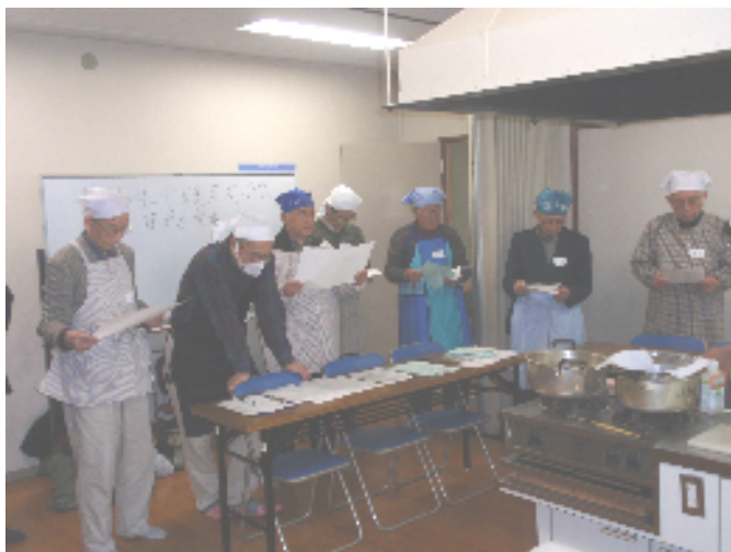
写真1：熱心に食事の作り方を聞いている様子

今後も男性介護者交流会は実施します。是非、開催の折には男性介護者の皆さんご参加ください。今年度（平成24年度）の男性介護者交流会の開催予定については、7月、10月、1月になっておりますので、詳細が決まりましたら、お知らせいたします。